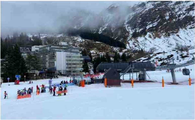
La gare de la nouvelle télécabine de Cotch.

Les pitchouns grands gagnants Ils n'en ont évidemment pas conscience, mais les premiers à en tirer bénéfice sont les enfants du Jardin des neiges qui accueille les tout-petits. Situé à côté de la nouvelle gare d'embarquement de la cabine, le Piou Piou, c'est son nom, a quadruplé sa surface. Et ce n'est pas le seul avantage. Kit, monitrice ESF (Ecole du ski français) en place depuis 25 ans, témoigne : « On a deux pentes différentes selon le niveau des enfants et on a un tapis couvert. Il y a des sanitaires adaptés aux enfants, avec un abri en cas de mauvais temps. On a vraiment gagné énormément en qualité d'accueil et de confort ». Le village des enfants occupe, en effet, l'espace du départ de l'ancien télésiège de Cotch. Un confort global loué aussi par Jean-François Esquerre, le directeur de la station : « Les cabines sont modernes et donc très confortables. Cet aménagement change notablement le décor visuel du pied des pistes. C'est moderne et bien intégré. On a fait disparaître les anciens bâtiments, vétustes et disgracieux, qui obs-