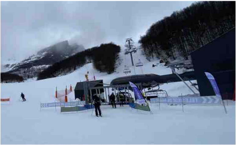
Le télésiège de Sarrière qui permet de monter en haut du secteur de Cotch. P. Baudron

Snowmap.fr est un site internet qui permet de connaître avec précision l'enneigement des montagnes en France. Il permet d'accéder, en une même page, à une somme d'informations importantes, comme l'enneigement actuel, le Bulletin d'estimation des risques d'avalanche (le fameux BERA établi par Météo France), l'inclinaison des pentes, l'emplacement des stations de ski ou des refuges. On y trouve même des topos de sorties.