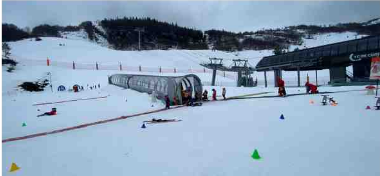
L'espace enfant a été quadruplé en surface. Pascal Baudron

Débutants, piétons et SnowKfé profitent de l'aubaine Le restaurant d'altitude, le SnowKfé, situé juste à côté de la gare d'arrivée, est aux premières loges pour mesurer le changement. Avant, les clients devaient monter jusqu'en haut de Cotch et redescendre une piste rouge ou une bleue un peu difficile. « Maintenant, ils arrivent avec les cabines, explique Sylvain, le responsable du site. On voit des piétons avec des poussettes, ce que l'on n'avait évidemment pas avant. On voit passer aussi beaucoup plus de monde, d'où un chiffre d'affaires en hausse ».